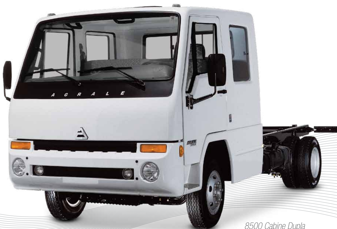
8500 Cabine Dupla