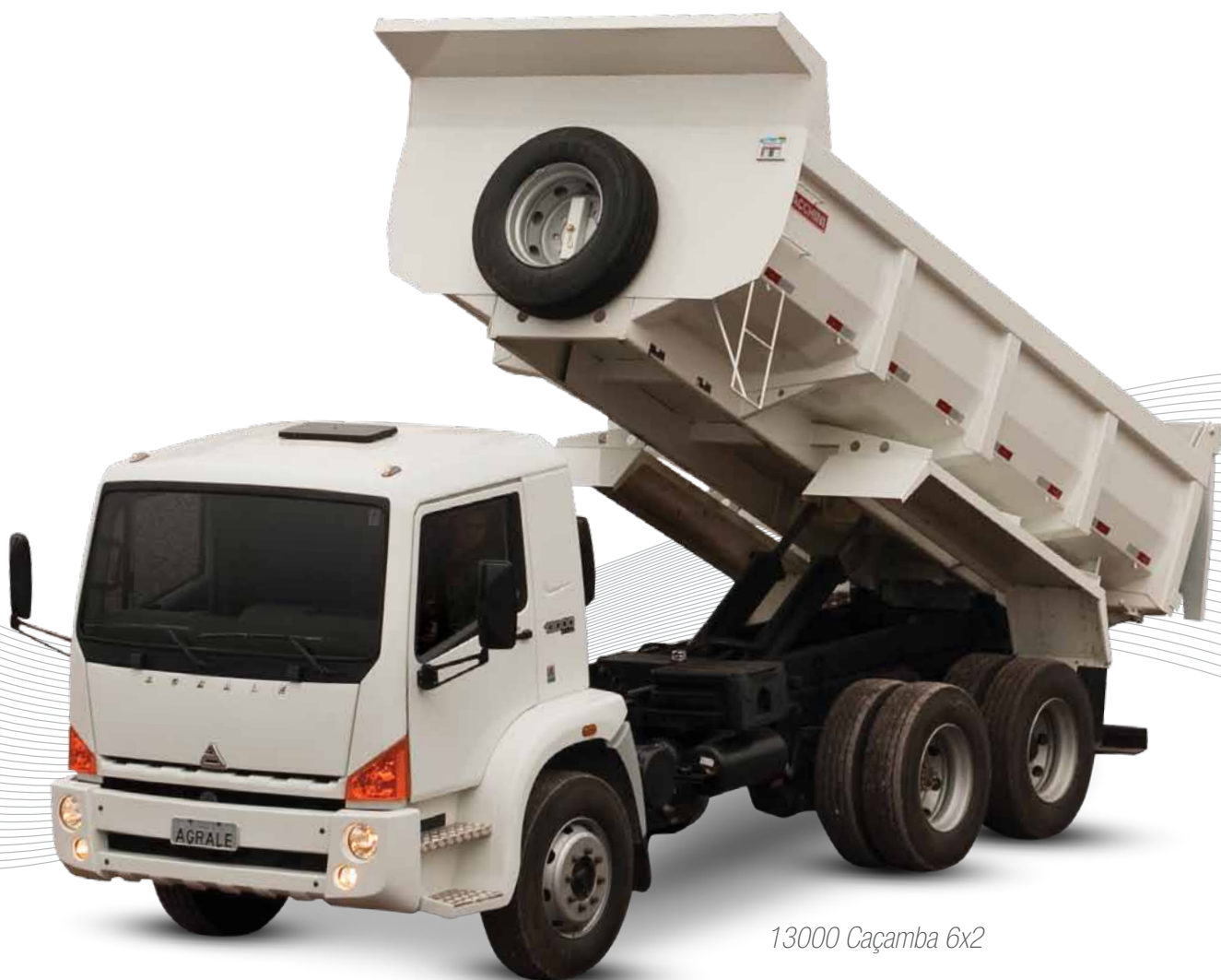
13000 Caçamba 6x2